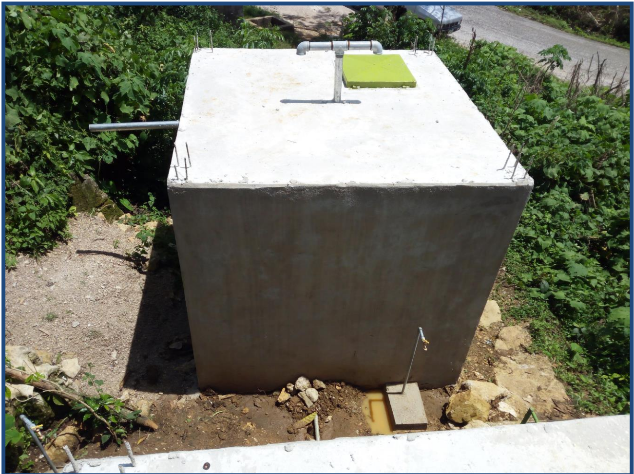
Construcción de tanque individual para almacenamiento