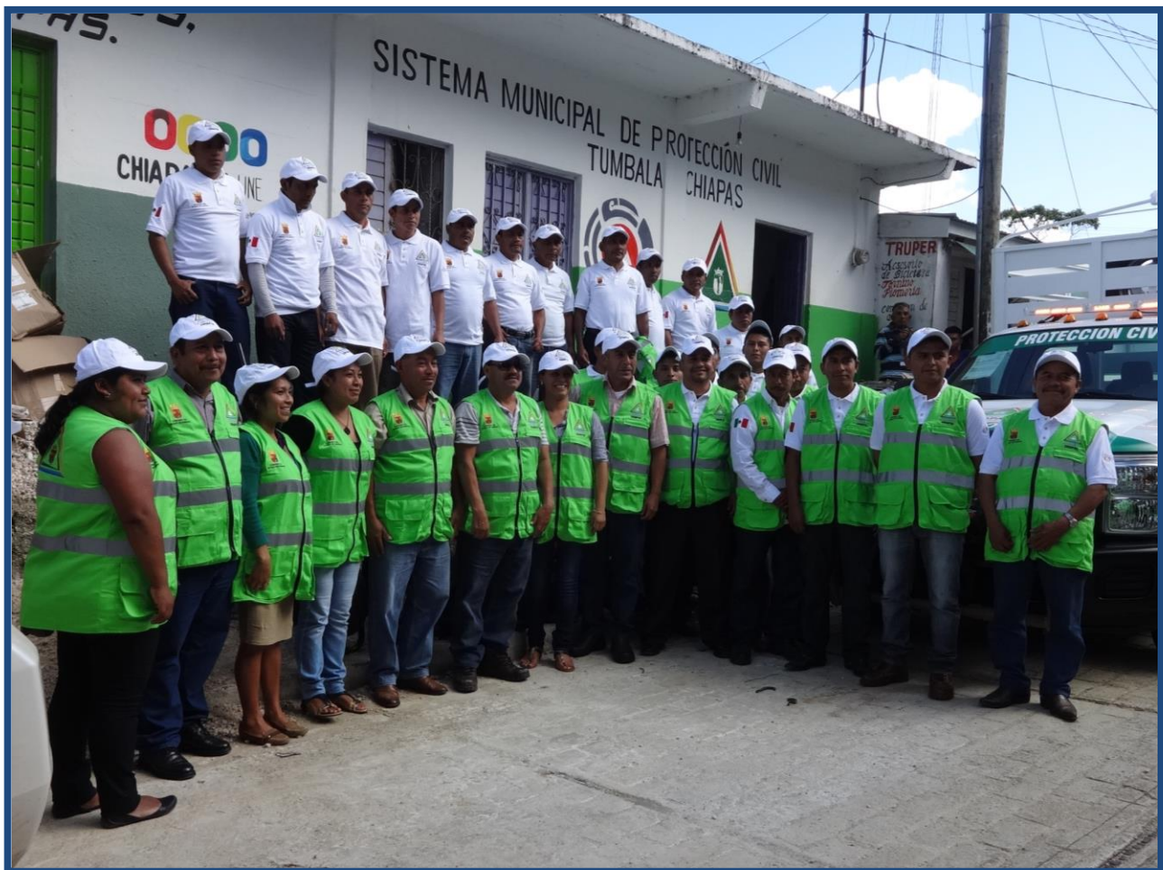
Coordinación de Protección Civil