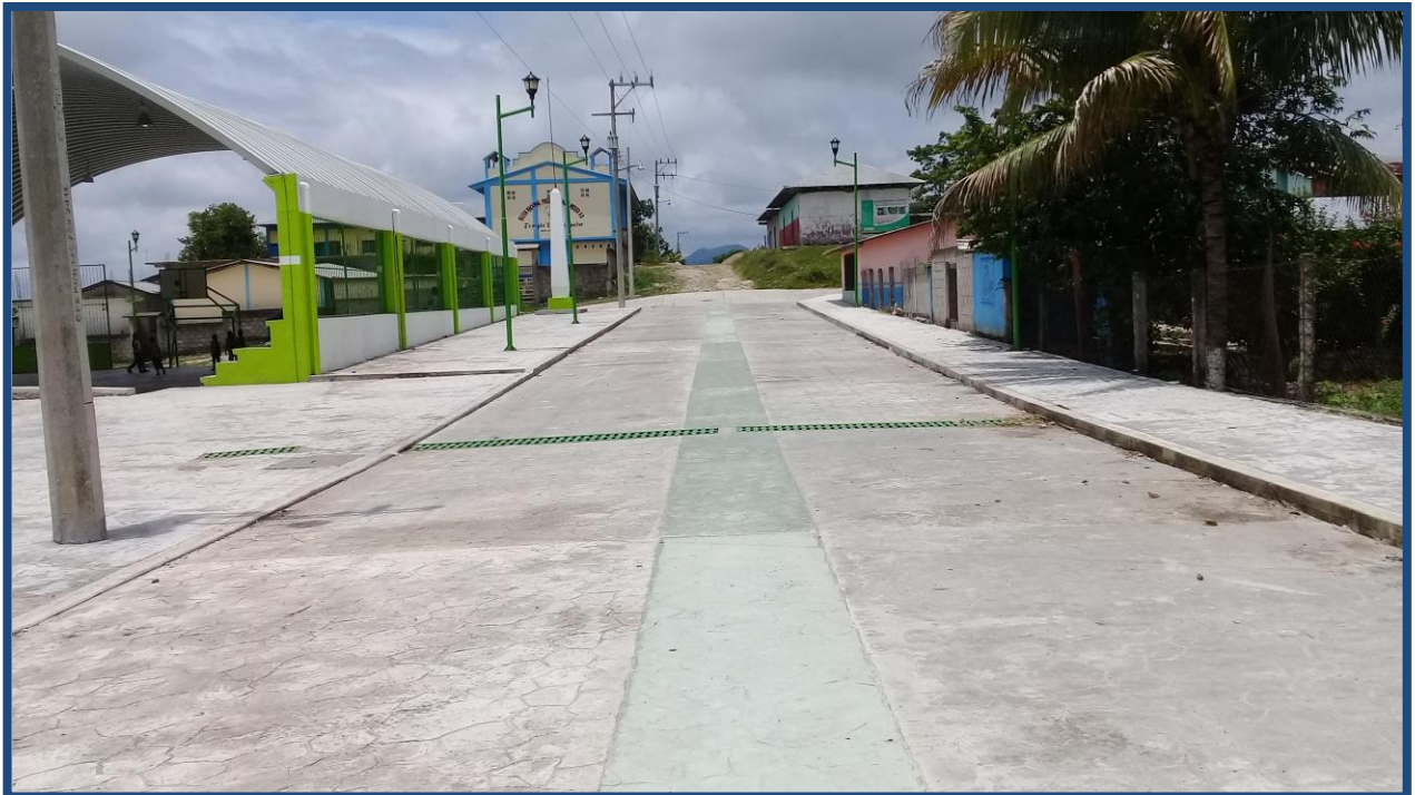
Pavimentación de calle con concreto hidráulico