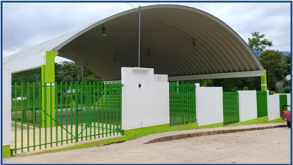
Construcción y techado de cancha de usos múltiples