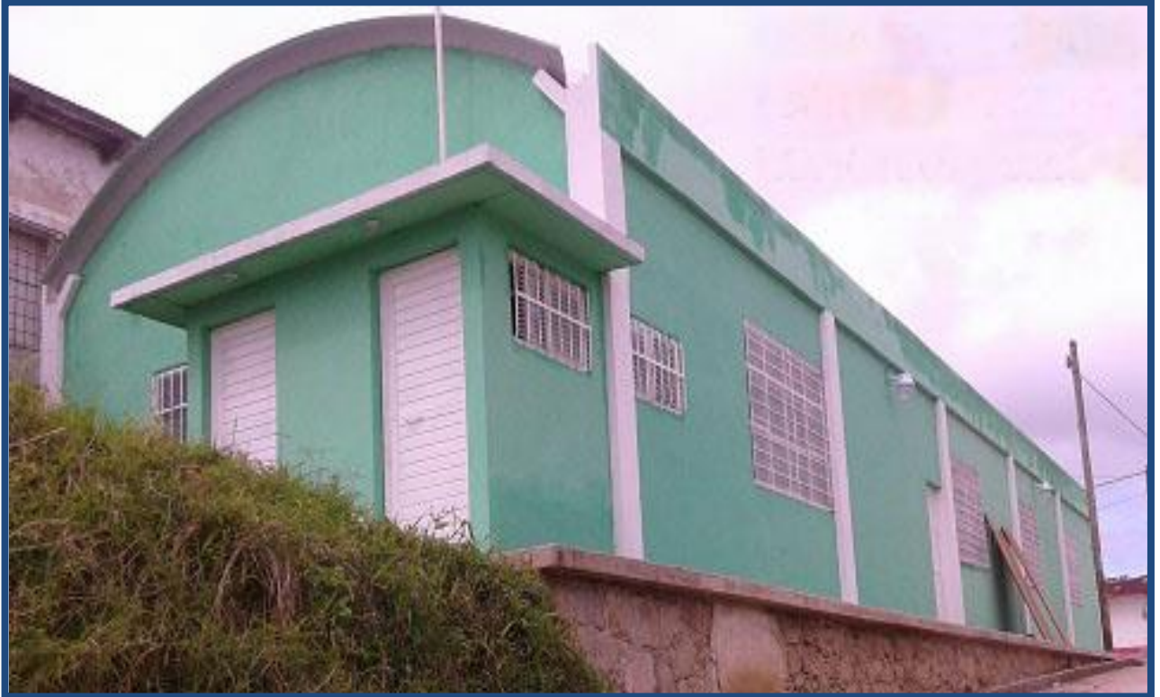
Rehabilitación y ampliación de casa ejidal en el barrio Guadalupe