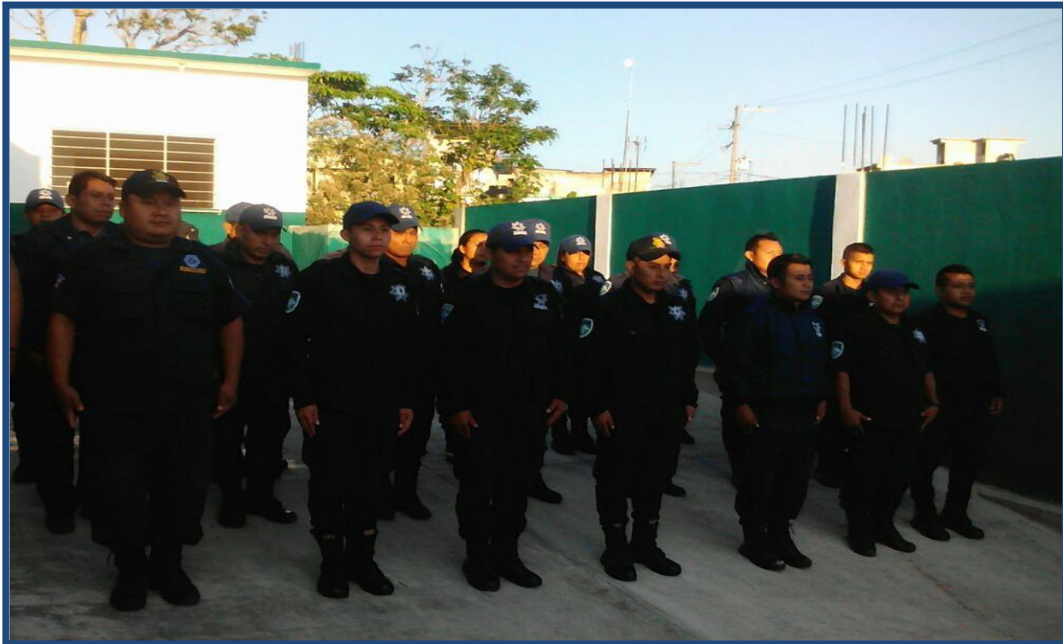
Dirección de Seguridad Pública Municipal