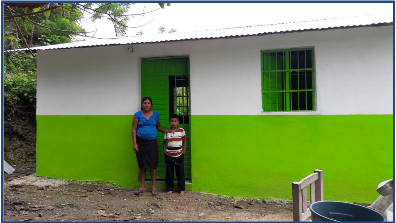
Construcción de Vivienda