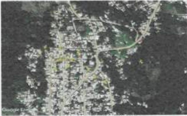
CROQUIS DE LOCALIZACION

CFO CLAVE MPAL: 100 FECHA: 31/05/2024 HOJA: 7 DE 7 MES: Mayo